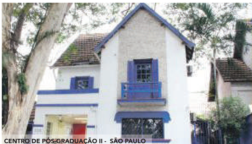
CENTRO DE PÓS-GRADUAÇÃO II - SÃO PAULO