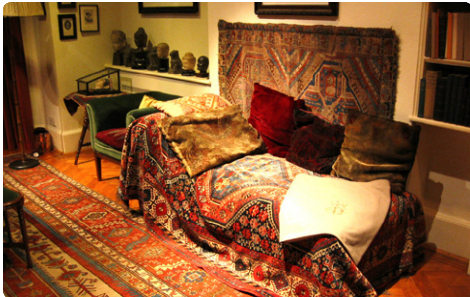
O divã utilizado por Sigmund Freud. O ambiente físico do gabinete psicanalítico, de confiança, descontração e aconchego, é fundamental para o sucesso do tratamento.