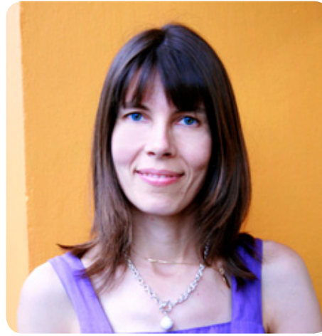
Professora Sari, que leciona inglês, francês, finlandês e sueco na Escola Millennium - Unidade Chácara Sto. Antônio, ajuda seus alunos a se desbloquearem para ter um desenvolvimento maior e mais rápido na língua.

3: Você sente qualquer melhora no seu relacionamento com pais, esposas, filhos, amigos ou colegas depois que começou na Millennium? - 75% dos estudantes responderam sim. Comentários: "entendo o comportamento dos outros melhor"; "sinto-me mais seguro